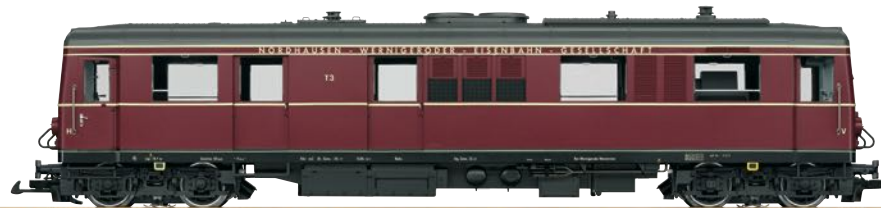
26390 Dieseltriebwagen T3