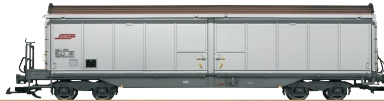
48575 RhB Schiebewandwagen Haik-v