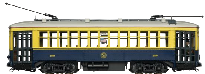
20384 Straßenbahn No. 130 San Francisco