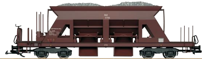
46696 RhB Selbstentladewagen