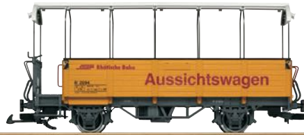
34252 RhB Aussichtswagen