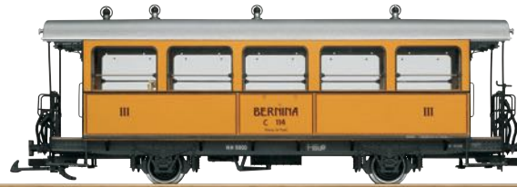
30563 RhB Barwagen C 114