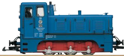
20323 MBB Diesellok V 10C