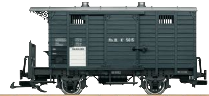
45302 RhB gedeckter Güterwagen