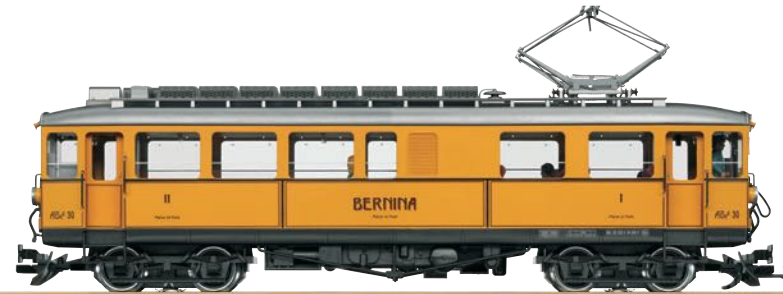
25392 RhB Triebwagen ABe 4/4 30